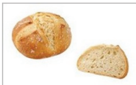
Suggestion de présentation

Produit cuit : Poids moyen : 50g (à titre informatif) Longueur : 8.5 cm \pm 1.5 cm Largeur : 8.5 cm \pm 1.0 cm Hauteur : 5.0 cm \pm 0.5 cm